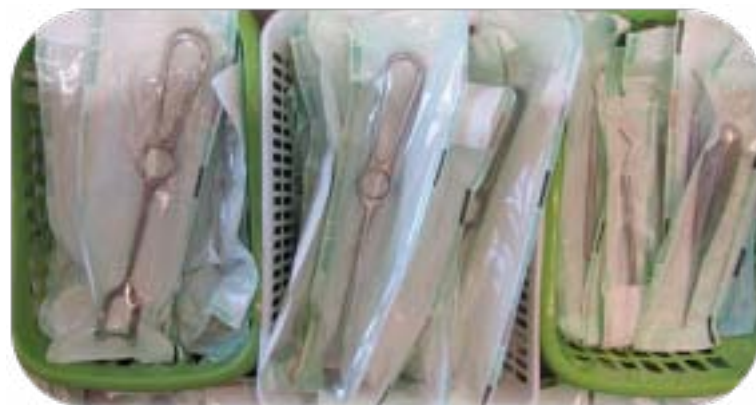
Salle de stérilisation

👤 Les assistantes dentaires lavent et désinfectent les zones de traitement (unités et périphériques) après chaque patient avec la méthode "Spray/nettoyage/Spray"