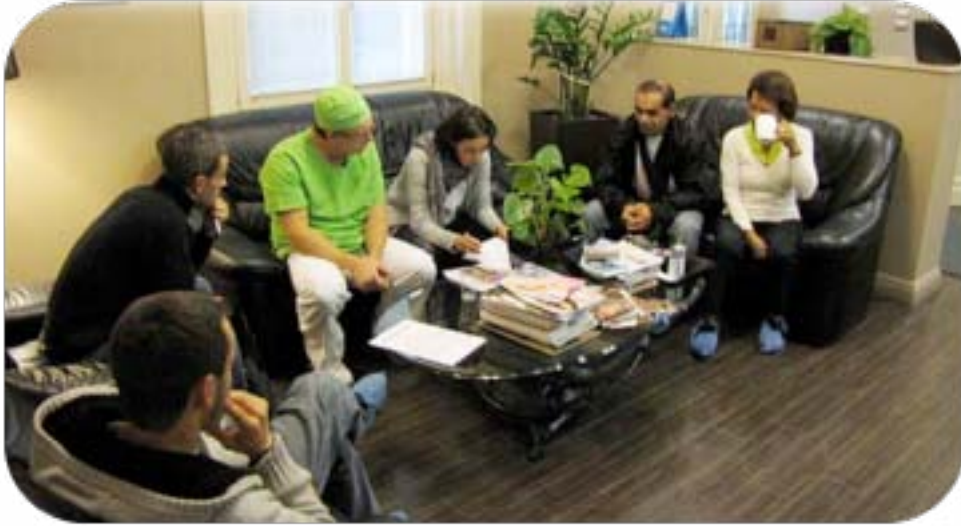
Photo salle d'attente