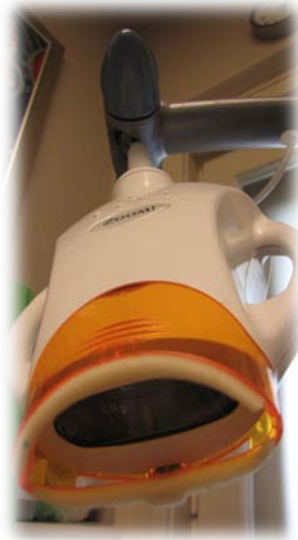
Système de blanchiment au fauteuil ZOOM