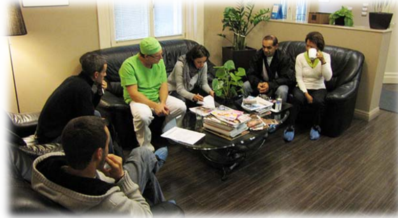
Photo salle d'attente