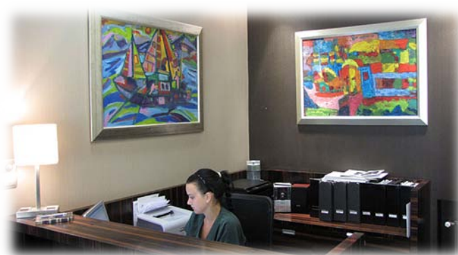
Photo hall de réception

➤ L'accueil du patient est bien organisé (hôtesse spécifique, le patient est reconnu et appelé par son nom, avertit des éventuels retards du dentiste)