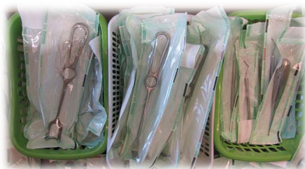
Salle de stérilisation