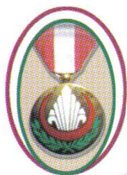
Médaille du mérite