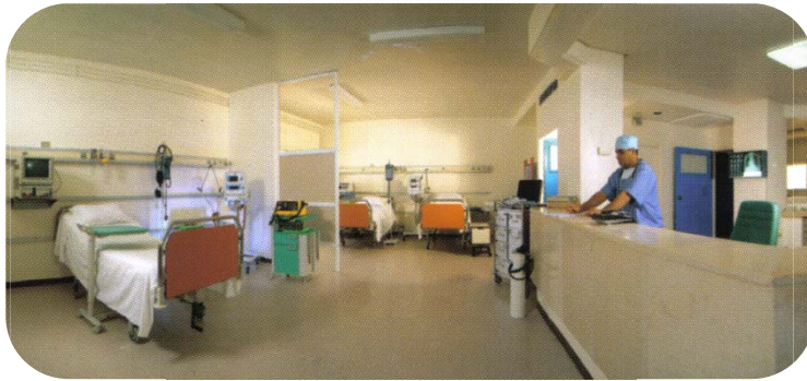
Salle de réanimation composée de 10 lits